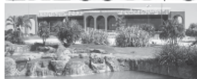
PALÁCIO ARAGUAIA - Praça dos Girassóis